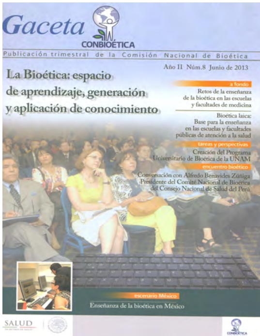
Gaceta Conbioética, Año 2, No. 8, junio 2013. 40 p. — México: Comisión Nacional de Bioética