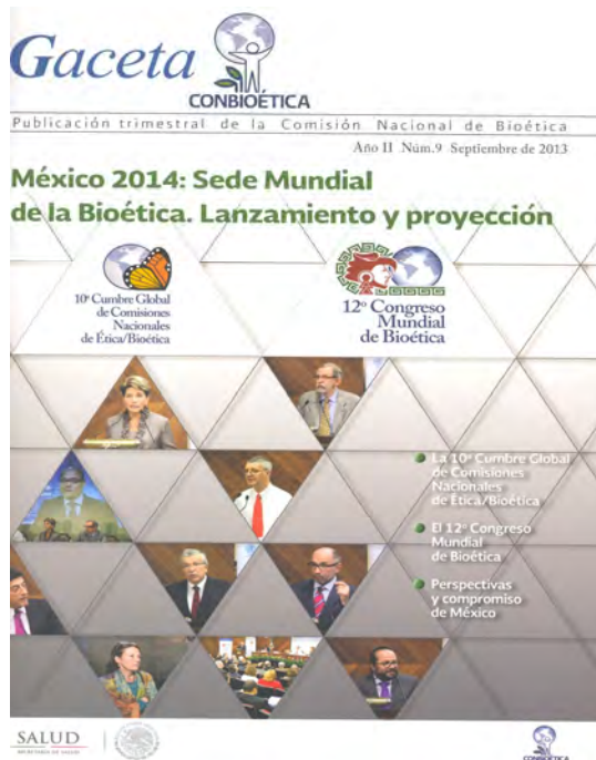
Gaceta Conbioética, Año 2, No. 9, septiembre 2013. 40 p. — México: Comisión Nacional de Bioética