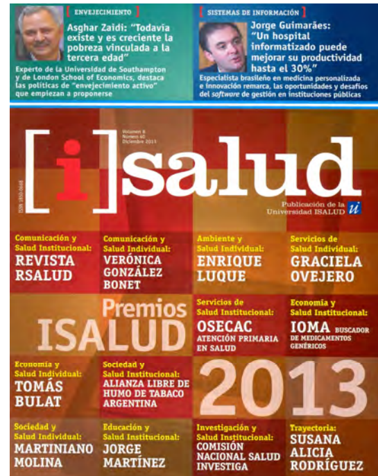
Isalud, Vol. 8, No. 40, 2013. 66 p. — Argentina: Universidad Isalud