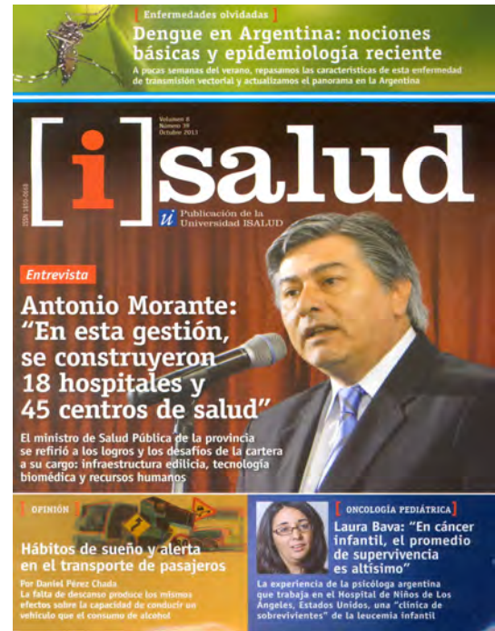
Isalud, Vol. 8, No. 39, 2013. 66 p. — Argentina: Universidad Isalud