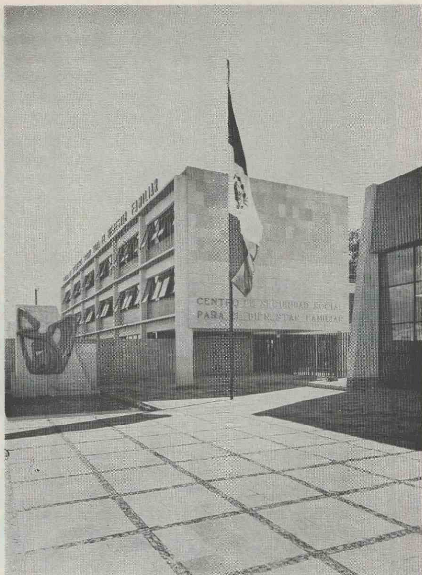
Uno de los Centros de Seguridad Social para el Bienestar Familiar en donde se imparten conocimientos de dietética, higiene y prevención social, cultura estética, cultura general, práctica doméstica, recreación social y estancia infantil.