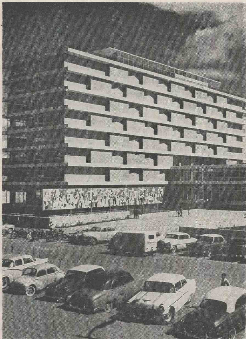
El nuevo edificio del Instituto Guatemalteco de Seguridad Social.