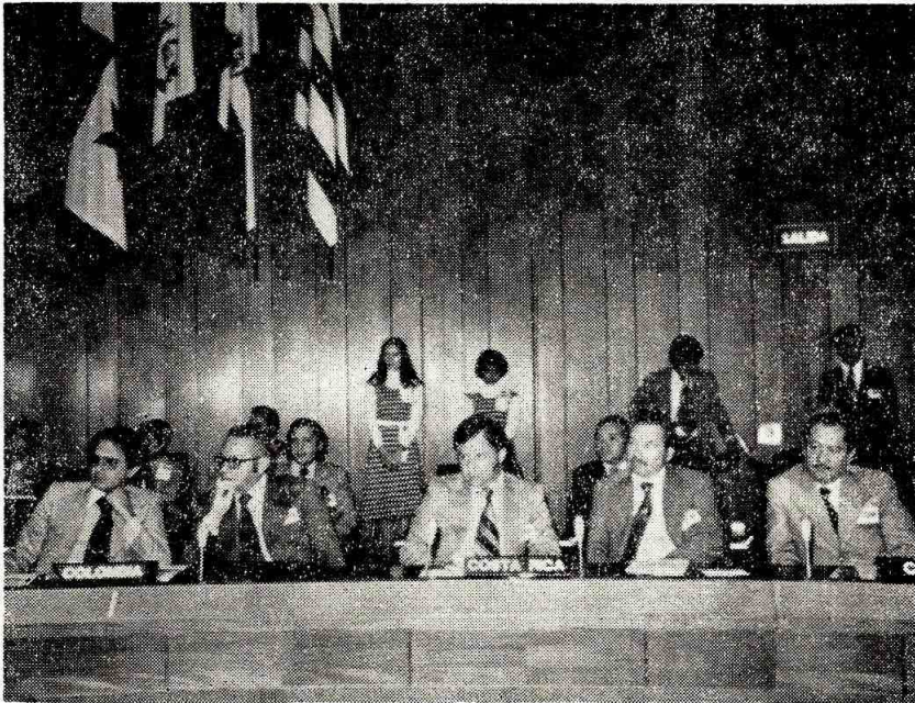
Los integrantes de las delegaciones de Colombia y Costa Rica, siguen con atención el cumplimiento del orden del día de la XXII Reunión del CPISS