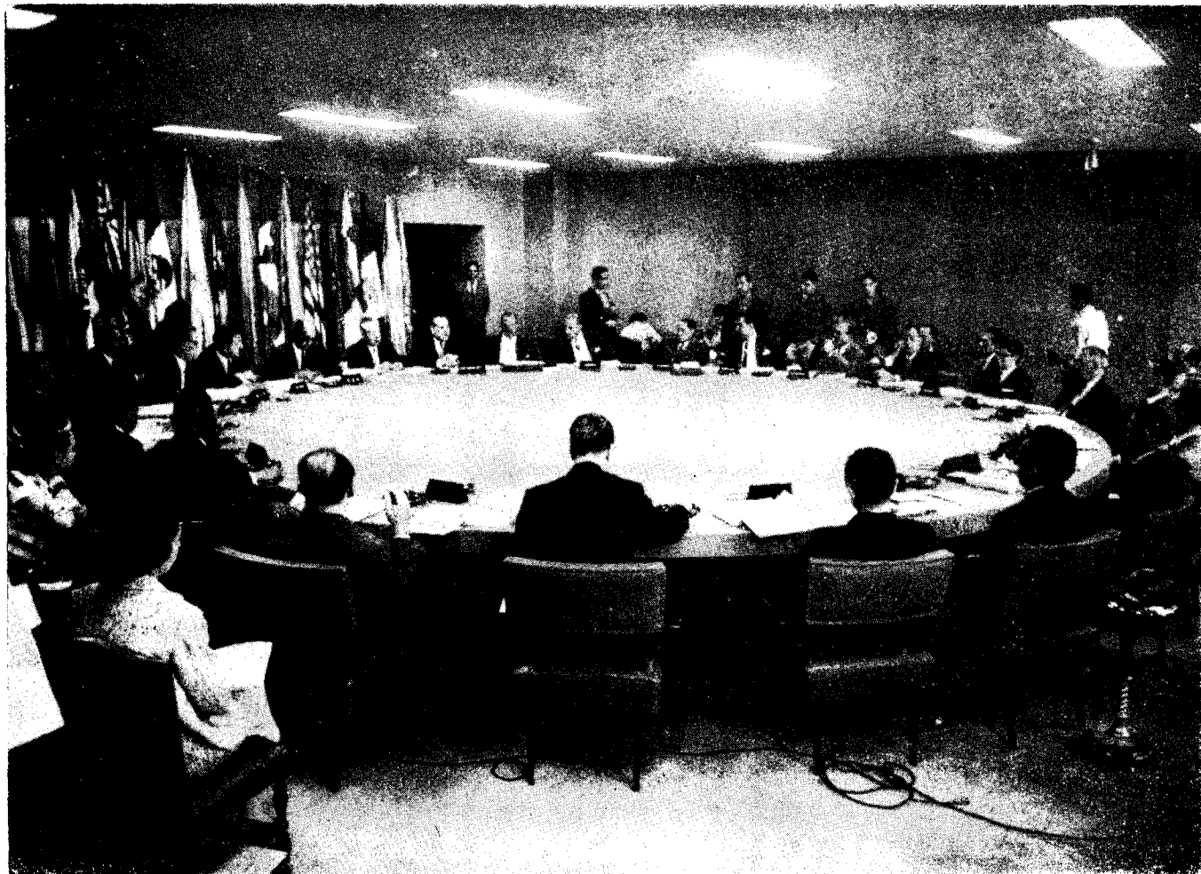
Vista general de la Sala de Conferencias del C.P.I.S.S., en ocasión de su VIII Reunión.