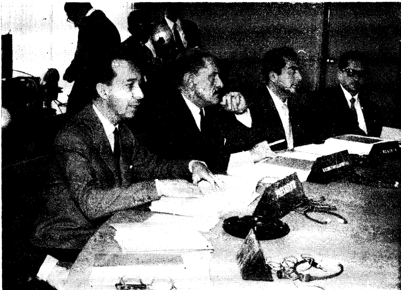
El Sr. Presidente del C.P.I.S.S., Lic. Antonio Ortiz Mena, en su declaratoria de inauguración de la VIII Reunión del Comité.